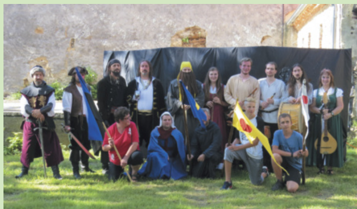
Den města 2017 a Historické odpoledne na zámku.