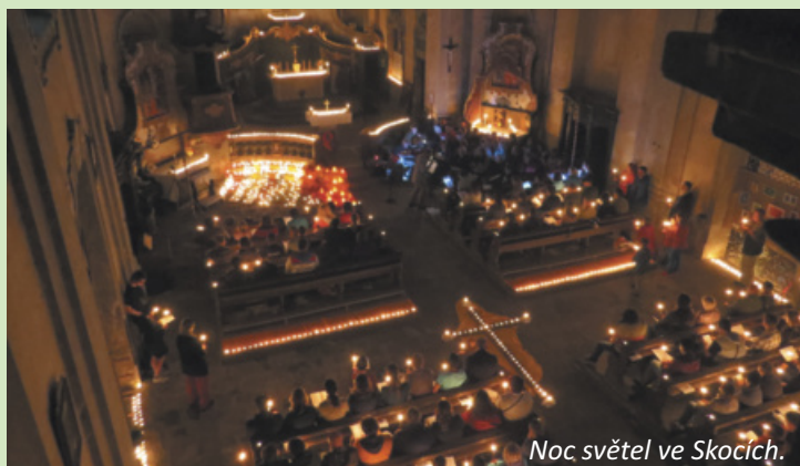
Noc světél ve Skocích.

Skoky s Toužimí váží i další historické vazby, Skoky byly dříve součástí údrčského statku toužimského panství markrabat z Baden Badenu a na stavbě skocké kaple se podílel v roce 1717 jeden z toužimských zedníků. Tyto historické vazby dnes připomíná mariánská poutní trasa Skocké stezky, která propojuje klášter v Teplé přes Toužim se Skoky.