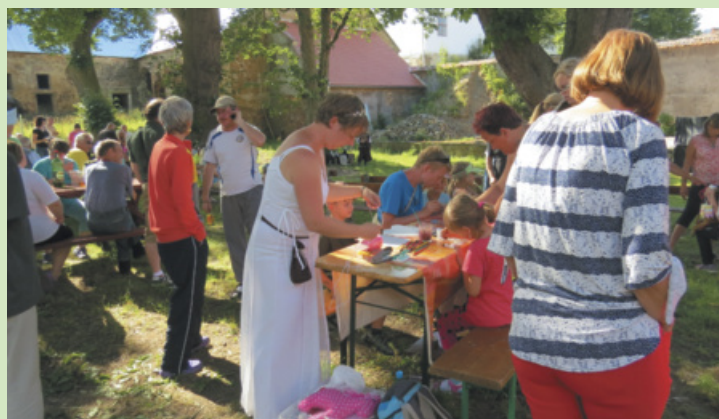
1 Den města 2017 a Historické odpoledne na zámku.