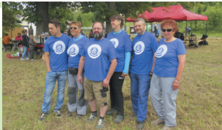
Organizátoři tradičního Setkání u pramene Střely v Prachometech.