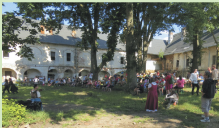
Den města 2017 a Historické odpoledne na zámku.