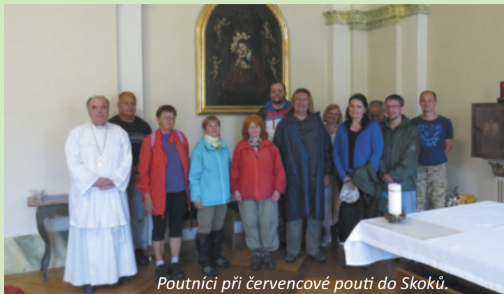
Poutníci při červencové pouti do Skoků.