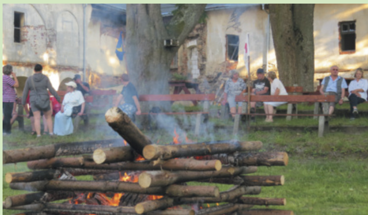
Husův den v Toužimi.