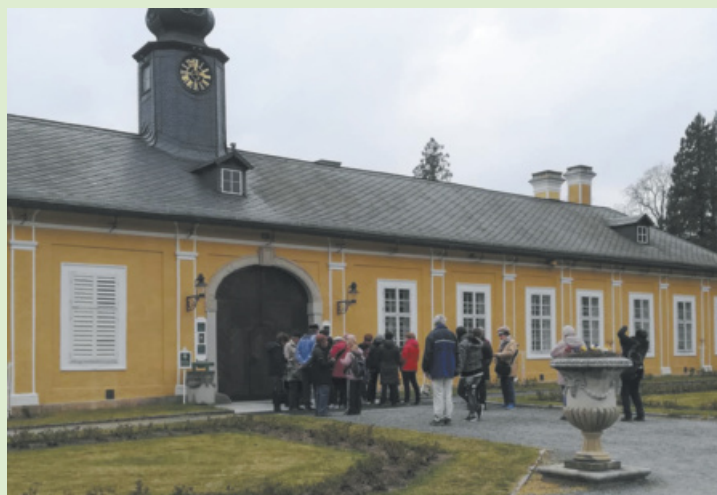
Výlet za humna - tentokrát na zříceninu hradu Radyně, zámek Kozel a rotundu sv. Petra a Pavla ve Starém Plzenci.