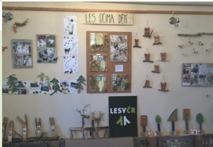
Z výstavy žáků ZŠ a MŠ Toužim "Les očima dětí" v infocentru. Součástí akce byla prodejní výstava velikonočních výrobků.