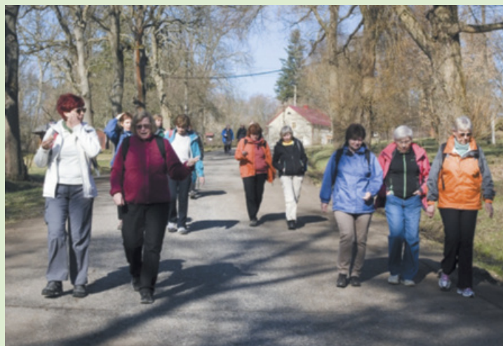
Letošní Jarní setkání turistů Karlovarské oblasti proběhlo v Toužimi a zúčastnilo se ho na 300 návštěvníků.