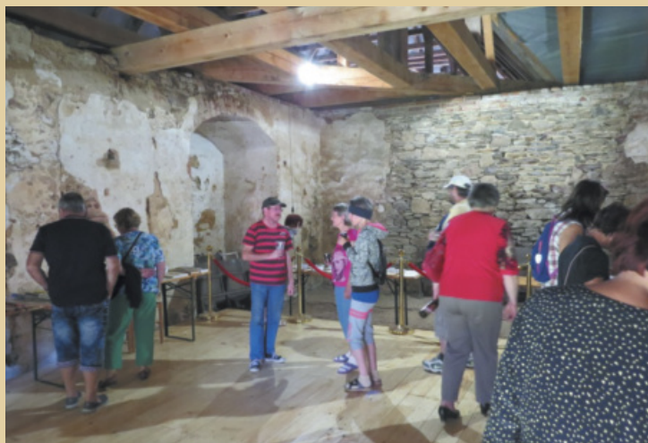
Během podzimní pouti a slavností města si návštěvníci mohli prohlédnout výstavu knih v nově opravené místnosti Janova hradu. Na instalaci nové podlahy má zásluhu především spolek Živý zámek.