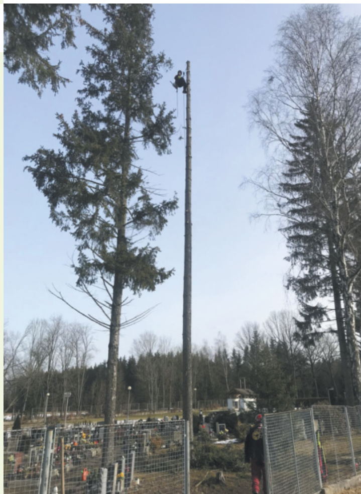
Likvidace vzrostlých a nebezpečných smrků na hřbitově.

V březnu nás ještě čeká sčítání lidu, domů a bytů. Podrobnější informace naleznete na straně 2 a během prvního březnového týdne budou aktuální informace uveřejněny na webových stránkách města www.touzim.cz . Přejeme všem klidné a sluncem zalité dny. -IC-