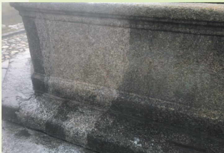
Čištění kašny na náměstí.