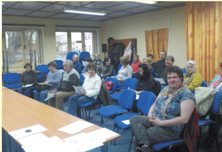
Účastníci přednášky o oživení paměti.