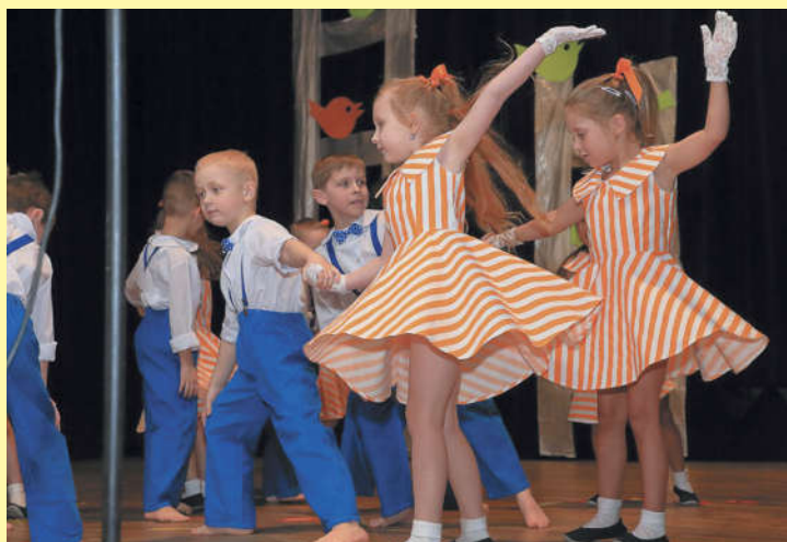
Toužimská MATEŘINKA 2018